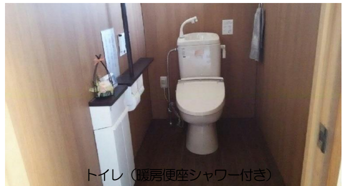
トイレ (暖房便座シャワー付き)