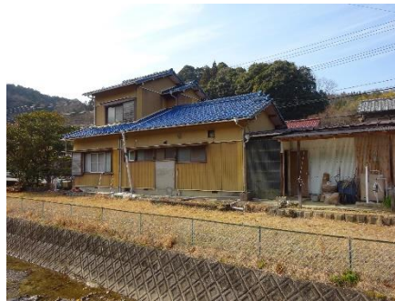
【外観（東側用水路面）】