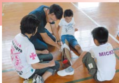
昨年の防災こども教室で応急手当を学ぶ子どもたち