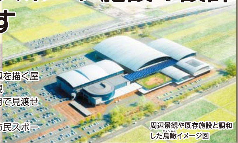
周辺景観や既存施設と調和した鳥瞰イメージ図