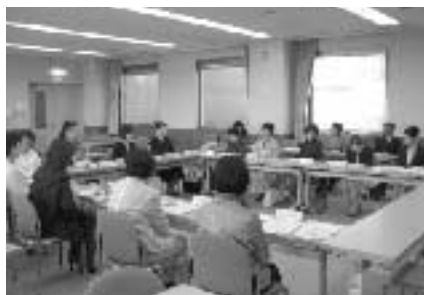
フォーラム実行委員会議の様子