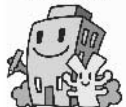
経済センサスキャラクター