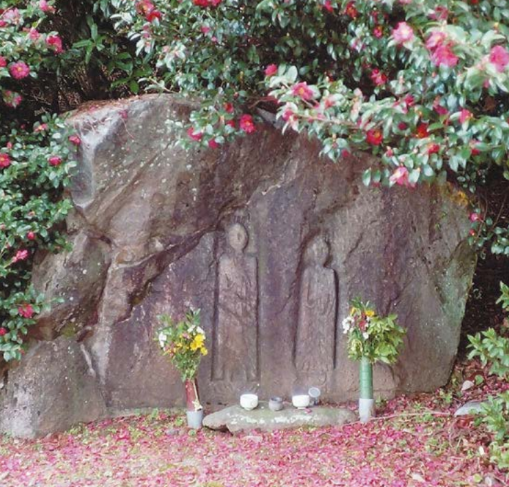
2体の仏像が彫られた紙屋観音

この安濃ダムのダム湖である錫杖湖を右手に、伊賀市へと至る県道42号線を西に行くと、傍らに「紙屋観音」と呼ばれる石仏があります。この石仏は、元はこの位置にあったのではなく、ダム湖に沈んだ旧道沿いの巨石に彫られた磨崖仏で、ダム建設の際に石仏の部分が切り取られ、現在の位置へと移されました。