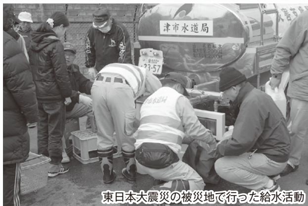
東日本大震災の被災地で行った給水活動