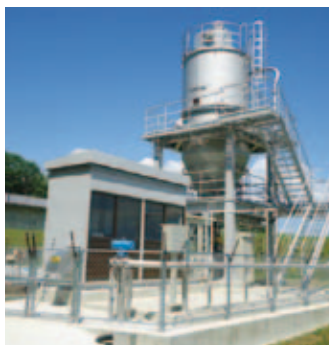
片田浄水場の急速ろ過設備 活性炭投入設備

安心安全で良質な給水を行うため、片田浄水場の急速ろ過設備活性炭投入設備などの整備を実施するとともに、配水効率向上のための老朽管更新や管網整備を行いました。