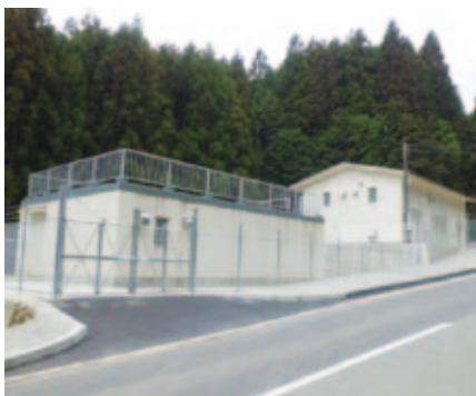
下之川簡易水道浄水場