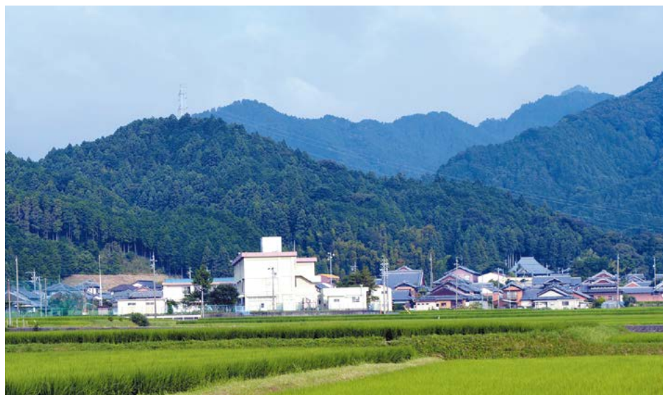
東側から見た雲林院城跡の遠景(鉄塔手前の山頂付近が主郭)

安濃川上流の芸濃町雲林院地区から県道42号を西へ向かうと、左手に美濃夜神社が見えてきます。この神社は、かつて溝淵大明神と呼ばれ、神社に残っている弘治元(1555)