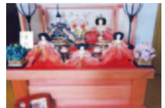
⑥ ひな人形…幅70cm×奥行45cm×高さ23cm、木製台の中に収納、人形はきれいだが台に少々変色あり、無料