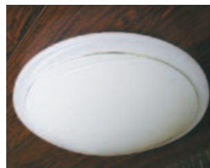
⑤ 蛍光灯照明器具…2011年製、消費電力65.7w、無料