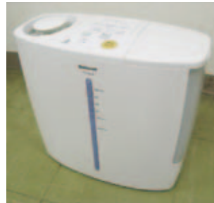
① 加湿器…幅40cm×奥行18cm×高さ36cm、加熱気化式、2005年製、無料