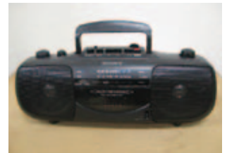
④ ラジカセ…幅35cm×奥行12cm×高さ14cm、無料