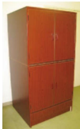
③ 布団ダンス…幅89cm×奥行79cm×高さ178cm、無料