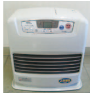
② 石油ファンヒーター…幅40cm×奥行32cm×高さ42cm、2008年製、最大消費電力4.3kw、無料