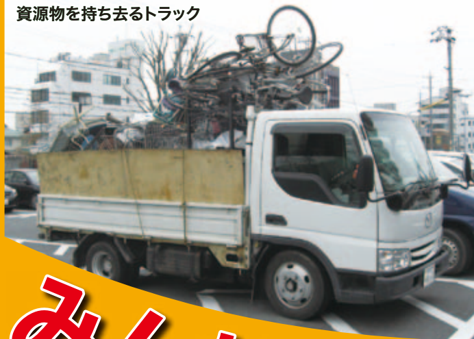
資源物を持ち去るトラック