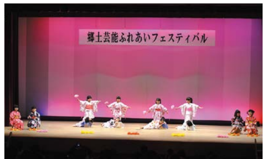
過去の郷土芸能ふれあいフェスティバルの様子