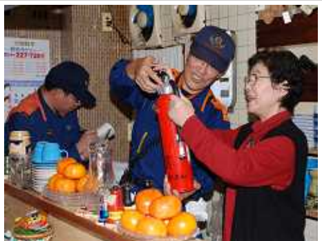
商店街の飲食店などを防火診断する中消防署員(11/14 大門商店街飲食店)