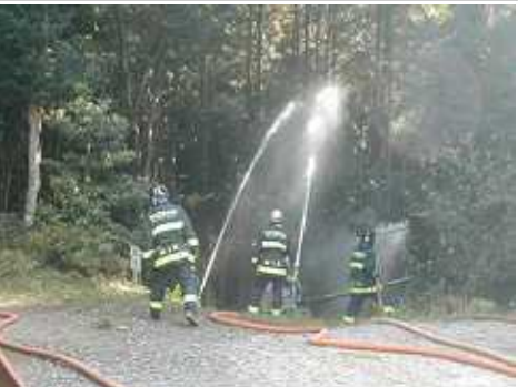
長谷寺付近で林野火災訓練を行う中消防署員(11/14 片田長谷町長谷寺付近)