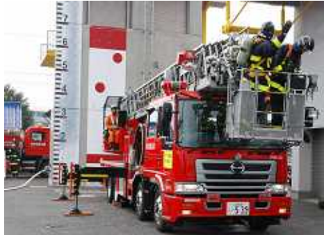
梯子車を使用して中高層建物の救出救助訓練を行う消防隊員(11/9 署長視閲訓練:久居署)