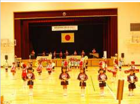
お遊戯しながら「火の用心のうた」を歌う幼稚園児たち(11/10 防火のつどい:白山体育館)