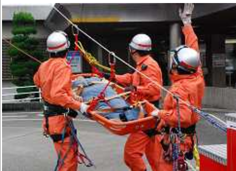
斜め展張したロープを使用して上層階の要救助者を救出する救助隊員(11/10 三重大学附属病院)