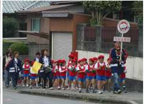
町内を防火パレードする高岡幼稚園児たち(11/9 一志町高野地内)