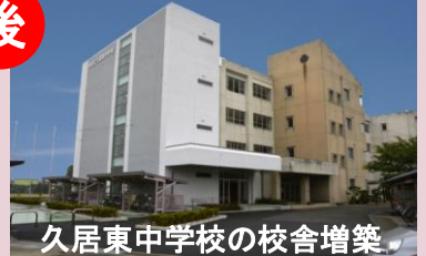
久居東中学校の校舎増築