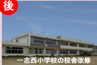
一志西小学校の校舎改修

プレハブ校舎の解消 南が丘小学校、西が丘小学校 事業費 約5億5千万円(H28年度までの2校の設計及び工事費)