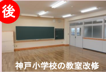
神戸小学校の教室改修