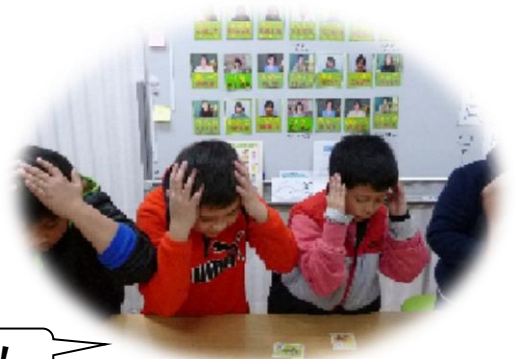
カルタとりをしました