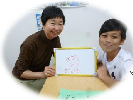
え 絵かきをしよう！