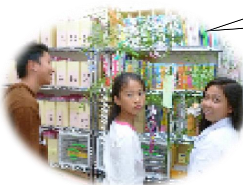
なせはた 七夕かざりを作りました

みんなで日本の遊びやゲームをします。 にほん あそ 日本の季節・行事の話や、 にほん きせつ ぎょうじ はなし 学校生活・行事の話（避難訓練・遠足・給食・水泳の用意について等）をすることもあります。 がっこうせいかつ ぎょうじ はなし ひなん くんれん えんぞく きゅうしょく すいえい ようい など