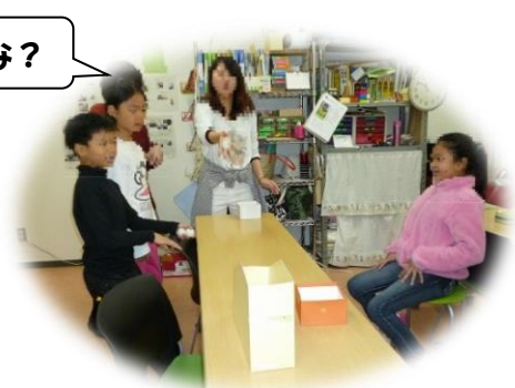
な 投げて入れよう！