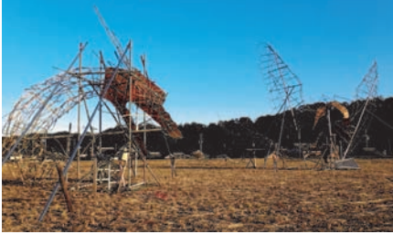
着々と準備が進むイルミネーション

テーマとしては、昨年の「復活」に、今年は「希望」を加え、イルミネーションに、フェニックスとともに巨大な青龍も登場し、未来に希望を持ってほしいという願いが込められているとのことです。