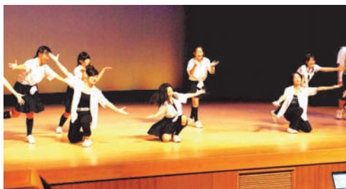
体育科ダンス(3年生)

このうち、3年生の人権劇は、修学旅行やこれまでの学習を踏まえ、自分たちの考えや思いを織り込んだ内容となっていて、人権の大切さを来場者にも訴え、人権尊重を正しく認識させる内容のものでありました。