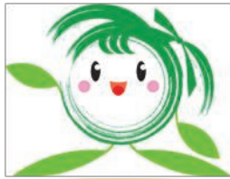
美里町PRキャラクター「ラブミー」