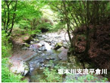
坂本川支流平倉川

雲出川に川上地区で合流する坂本川も大きな谷で、これに流れ込むりっぱな谷が平倉川です。