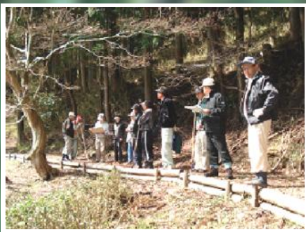
会員が知恵を出しあって地域づくりを・・・