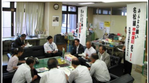
記者発表の様子(8/9津市役所市政記者室において)

美杉地域にお住まいの全員の皆さんが会員になっていただき、全線復旧を目指したいとのことです。自治会などを通して会員加入依頼がありましたら、地域振興に欠かせない名松線の復旧のため、ご協力をお願いします。