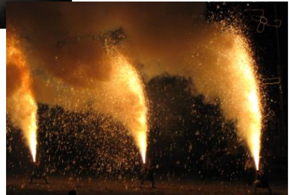
感動！ 山々に轟くみすぎの花火