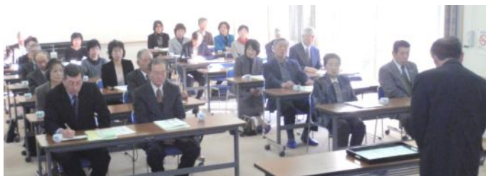
(ふれあいプラザ竹原での伝達式)

委員の任期は3年です。委員の皆さんにはお世話をかけますが、よろしくお祈りします。