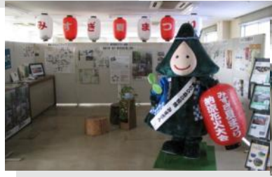
【美杉なんでも情報コーナー(総合支所2階)では、月変わりファッションでお出迎えV】