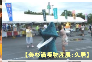
【美杉満喫物産展:久居】