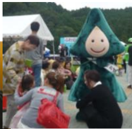
【白山ふれあいフェスタ】