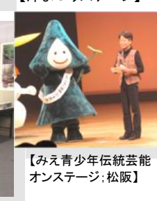
【みえ青少年伝統芸能オンステージ:松阪】