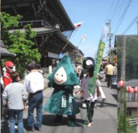
【一身田寺内町まつりでPR】