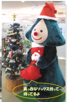
真っ赤なソックス持って待ってるよ