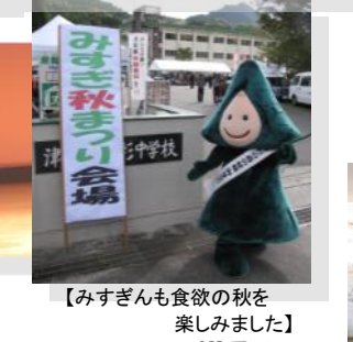
【みすぎんも食欲の秋を楽しみました】 うーん！満足！