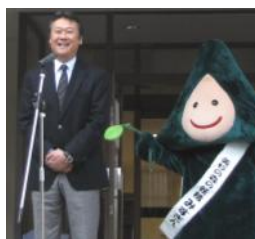
(市長さんもニコリあいさつ)