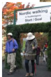
(レークサイド君ヶ野へ帰着)