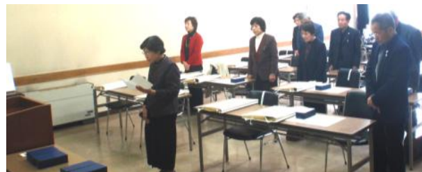
(退任される委員のあいさつ)

長きにわたり、地域福祉のため多大なご尽力をいただきました皆さんに厚生労働大臣、知事および市長からの感謝状と記念品の贈呈がありました。