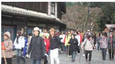
(家々に暖簾の掛る奥津宿をウォークする参加者)

伊勢本街道を活かした地域づくり協議会主催で、美杉地域の人を対象とした体験ウォーキングが行われました。