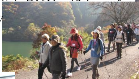
(湖畔の紅葉も天候が良すぎて霞んで見えます)