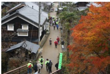
(飼坂峠を越えた参加者は、多気宿へと進みます)

気温も少し低めでしたが、「近くにこんなええところあるんやなあ」など、おしゃべりも弾む体験ウォーキングでした。