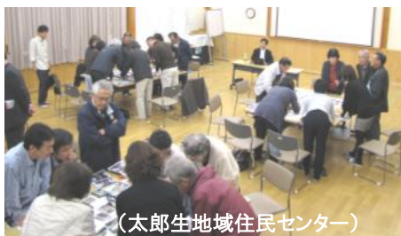
(太郎生地域住民センター)

集落機能再生きっかけづくり事業は住民自身が地域課題を解決し、元気な地域づくりを進める事業です。