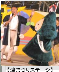
【津まつりステージ】