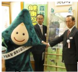
【名阪・関ドライブインのPRボード設置セレモニーへ】

12月11日(土)、道の駅美杉において津市森林セラピー基地PRモニターシステムの除幕式が行われました。皆さんも、ぜひPRモニターをご利用ください。