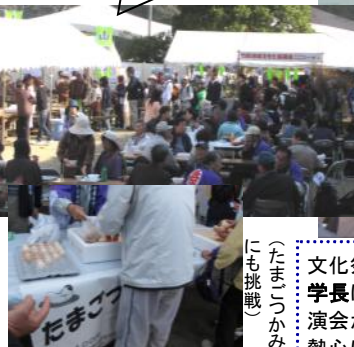
(たまごっかみにも挑戦)