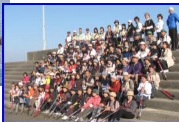
(二見の海岸で集合写真。お日様がまぶしい！)