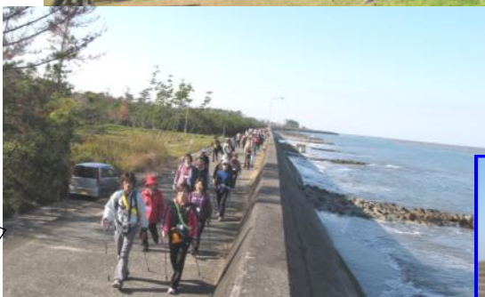
《20日(土)・潮風の二見コース》