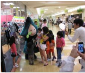
【高茶屋地内のショッピングセンターでPR】