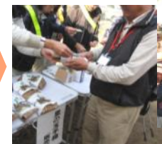
(まずは、「里の玉手箱」(お弁当)を受け取って…)