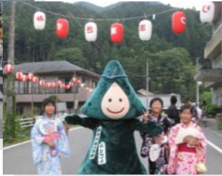
【みすぎ夏まつりで皆さんをお出迎えました】