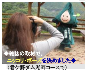
◆雑誌の取材で、ニッコリ・ポーズを決めました◆ (君ヶ野ダム湖畔コースで)