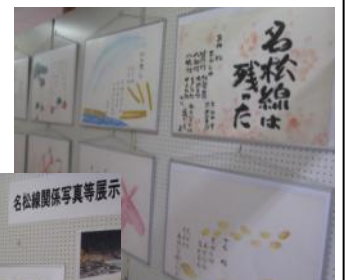
(写真等展示会場では懐かしい写真や絵に見入っていました)