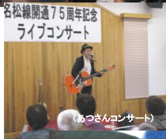
(あつさんコンサート)