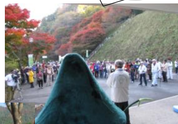
(レークサイド君ヶ野前で開会式)