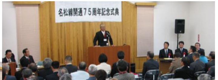
(求める会 結城会長あいさつ)

『名松線の全線復旧を求める会』では、この75周年イベントを契機に、『みんなで守ろう名松線』を合言葉に活動を続けていきますので、地域の皆さんの一層のご協力・ご参加をお願いしたいとのことです。