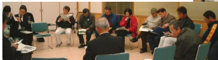
《多気地域住民センターで、地域の皆さん、県のプロデューサー、県・市の職員が車座になって意見交換》