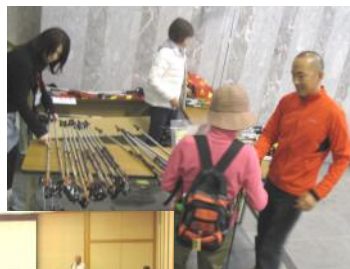
(県営サンアリーナ玄関)