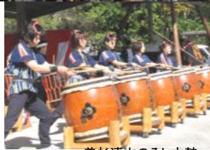
美杉連山のろし太鼓