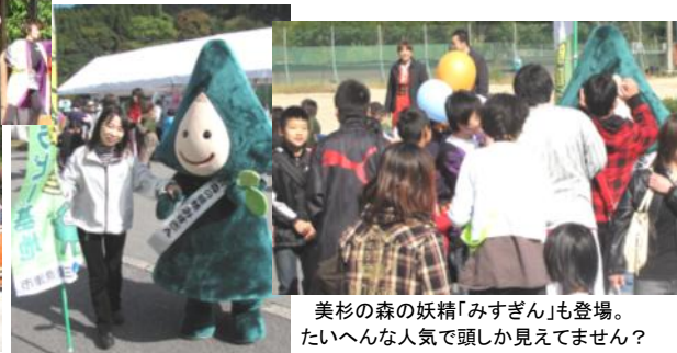
美杉の森の妖精「みすぎん」も登場。たいへんな人気で頭しか見えてません？