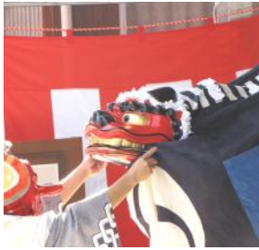
神楽の舞(丹生俣獅子舞)