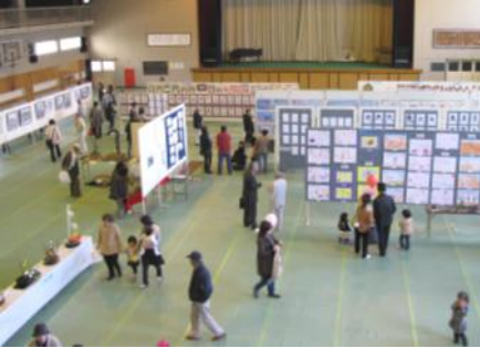
美杉中学校体育館の作品展示