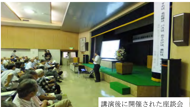
講演後に開催された座談会

現行の公共交通システムに修正を加えていく程度で美杉地域の公共交通は機能していけるのか、