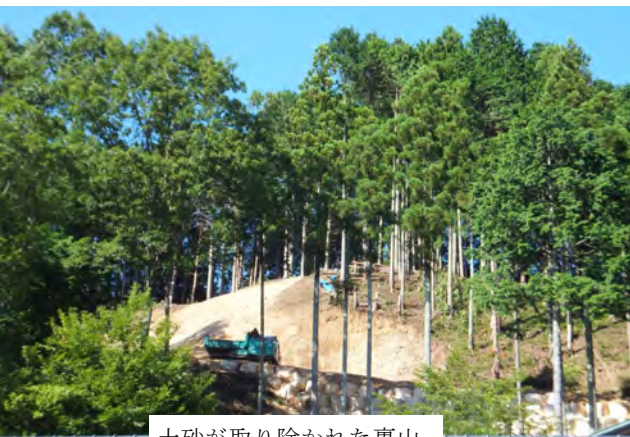
土砂が取り除かれた裏山

山の斜面に掘り進む工事が行われます。これらの第2期工事は、年内での完了が予定されています。