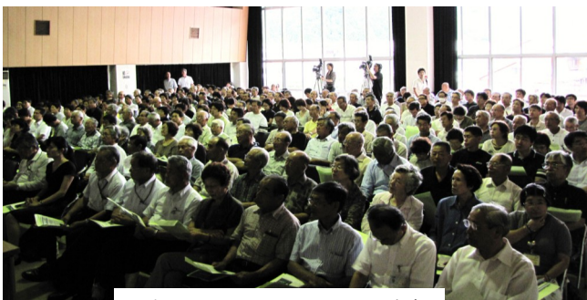
講演に聞き入る250人の聴衆

誰でも安心して暮らせる地域づくりのための「生活交通」と、誰でも楽しくおこし頂ける地域づくりのための「来訪交通」を組み合わせたい「お出かけ」ネットワークを構築していくため