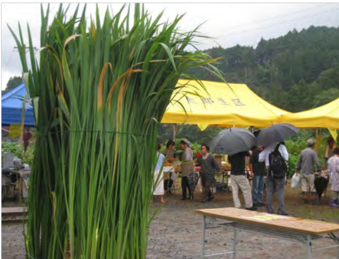
▲9月30日 まこも収穫祭