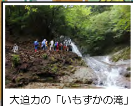
大迫力の「いもずかの滝」