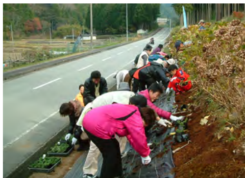
▲昨年の芝桜植栽の様子