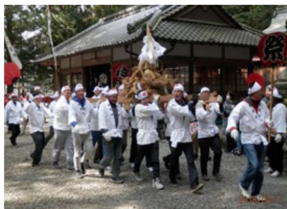
昨年のごんぼまつりの様子