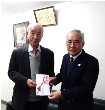
渡邊実行委員長(左)から日高会長(右)へ贈られました