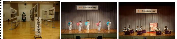
昨年的美杉文化協会成果発表会の様子