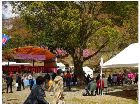
君ヶ野ダム公園桜まつり

ツアーの最後は、JR伊勢奥津駅で名松線を守る会の方々が横断幕を掲げて参加者を笑顔でお見送りしました。