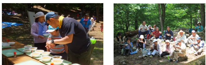
【 今年の青葉まつり 】

※ 雨天時の開催の有無は、当日(8:30~9:30)に、太郎生多目的集会所(☎273-0074)までお問い合わせください。