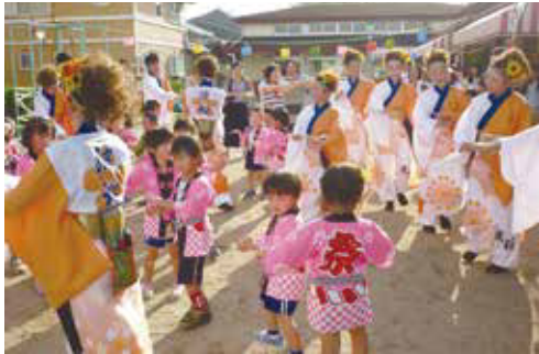
▶「波桜」のみなさんと盆踊りを踊る園児たち (7/2 明幼稚園)