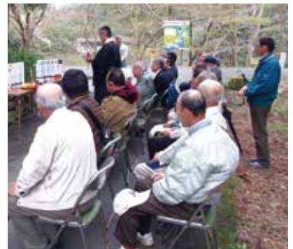
▲鳥獣慰霊祭(4/3)の様子

しかし、近年では、毎年増え続ける有害鳥獣を抑制するために、市や地域からの依頼により、年間を通じて有害鳥獣の駆除を行っています。昨年度中の鳥獣の駆除頭数は、317頭で、10年前の約10倍に増加しています。