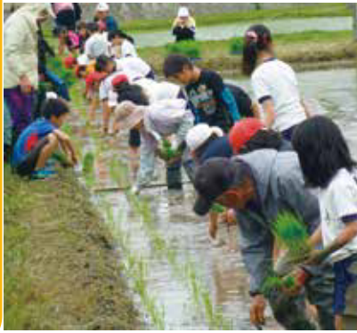
▲田植えをする明小学校の子どもたち

万一の火事に備えて 6月21日(火)、芸濃保育園で、給食室からの火災を想定した総合避難訓練が行われました。 訓練後、園庭に到着した消防車と救急車に興味津々の園