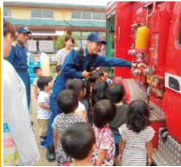
▲消防隊員に質問する園児たち

万一の火事に備えて 6月21日(火)、芸濃保育園で、給食室からの火災を想定した総合避難訓練が行われました。 訓練後、園庭に到着した消防車と救急車に興味津々の園