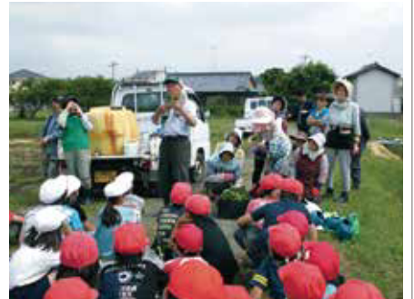
▲つるの植え方を教わる芸濃小学校の子どもたち

見たちは、消防隊員から、消防車の仕組みについて熱心に説明を受けていました。 秋の収穫を楽しみに 5月6日(金)、林川原の田んぼで、明小学校の4~6年