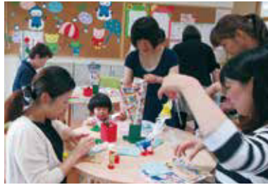
▲笹飾りを作る親子 (6/28 子育て支援センターぶちぶち)

地域の各施設で、七夕会や夕涼み会が開催されました。園児たちは、カラフルな色紙で笹を飾りつけたり、地元のおよこいチームのみなさんと盆踊りを踊ったりして、楽しいひと時を過ごしました。