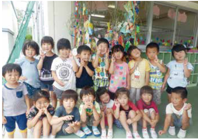
▲願いを込めた笹飾りの前で (7/7 椋本幼稚園)

地域の各施設で、七夕会や夕涼み会が開催されました。園児たちは、カラフルな色紙で笹を飾りつけたり、地元のおよこいチームのみなさんと盆踊りを踊ったりして、楽しいひと時を過ごしました。