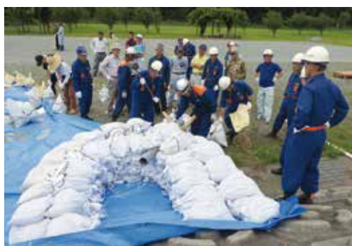
▲月の輪工法実践訓練の様子

水防訓練では、団員や会員総勢140名が参加し、津北消防署芸濃分署署員の指導のもと、