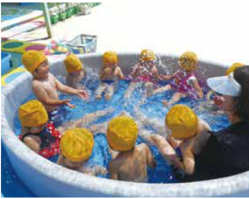
▶水をかけあつて遊ぶ園児たち (安西・雲林院幼稚園)

地域の各幼稚園、保育園で、プール遊びが始まりました。園児たちは、水の冷たさを肌で感じながら、水遊びを楽しんでいます。園内には、夏の暑さに負けず元気にはしゃぐ子どもたちの声が響き渡っています。