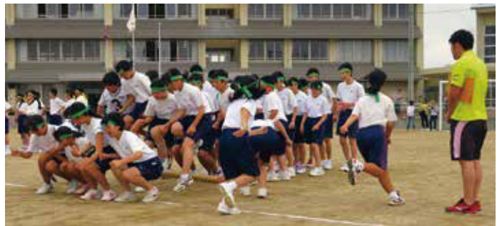
▲団体競技「台風の日」の様子