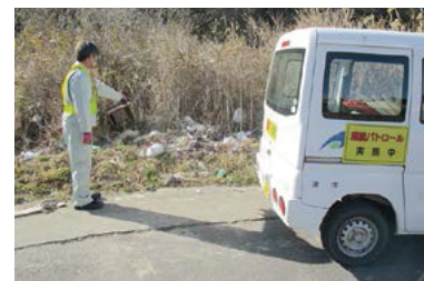
不法投棄監視パトロールの様子

津市では、きれいなまちにするために巡回・監視パトロールの実施、不法投棄禁止看板の自治会への配布を行い不法投棄の防止に努めていますが、皆さんからの情報提供も不可欠です。通報にご協力をお願いします。