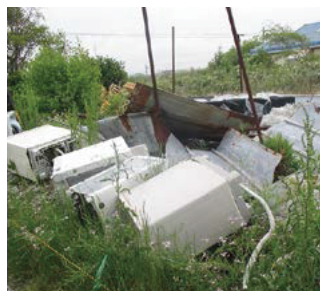
不法投棄された洗濯機

津市では不法投棄者が判明した場合、投棄者自身で処理するよう指導していますが、投棄者が不明の場合は土地の所有者(管理者)が自らの責任でごみを処理しなければなりません。土地の所有者(管理者)の皆さんは、不法投棄をされにくい環境をつくるため、右記のような方法で自己防衛をしましょう。