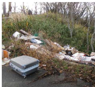
不法投棄された廃棄物