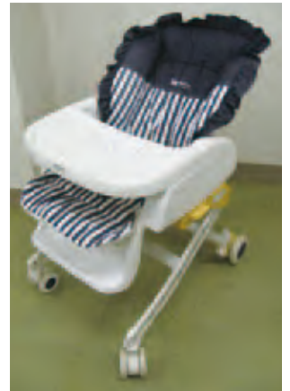
② ベビーラック…無料