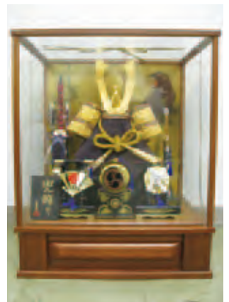
④ かぶと飾り…ガラスケース入り、幅54cm×奥行40cm×高さ68cm、無料