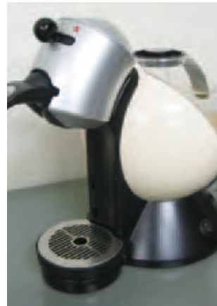
① コーヒーメーカー…幅21.4cm×高さ31.5cm×奥行33cm、取扱説明書付き、無料