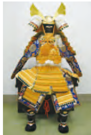
③ よろい飾り…幅50cm×奥行40cm×高さ35cm、飾り高さ約80cm、無料