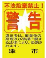
不法投棄禁止看板

されたごみは、投棄者自身で処理するよう指導していますが、投棄者が不明の場合は、土地の所有者(管理者)が自らの責任でごみを処理しなければなりません。定期的な巡回や不法投棄禁止看板・柵を立てる、草刈りを定期的に行うなどしてごみを捨てられにくい環境づくりに努めましょう。