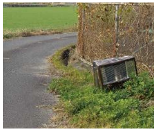
不法投棄された廃棄物