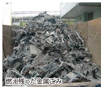
燃え残った金属ごみ

特に金属ごみが混ざってしまうと燃え切らずに残ってしまい、それが原因で焼却施設の機械が故障してしまう場合があります。修理には多くの時間や費用が掛かり、ごみ処理が滞ってしまいます。