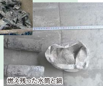
燃え残った水筒と鍋