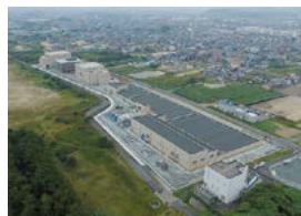
今年度から供用開始した志登茂川浄化センター

志登茂川浄化センターの供用開始に伴い、公共下水道が使用できる地域の拡大を目指して整備を進めていきます。