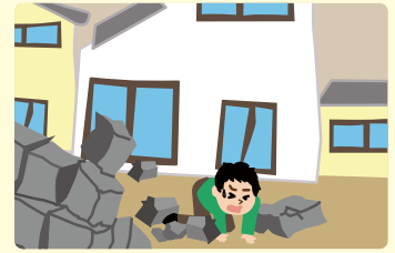
倒壊によりけがをする危険があります