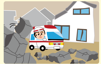
緊急車両の通行の妨げになります