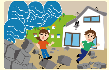
津波などからの迅速な避難を妨げます