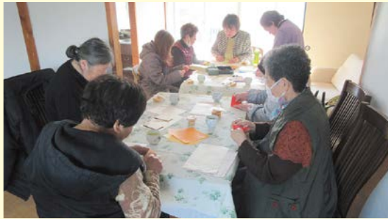
市営住宅で「ふれあい・いきいきサロン」事業を開催