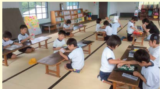
改修後の旧明村役場庁舎に「放課後子ども教室」を開設