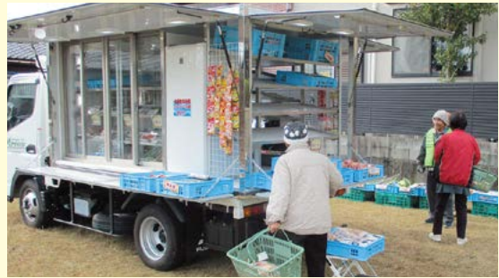
高齢者の買い物支援のため、移動販売車の公園占有を許可