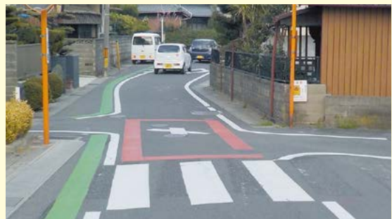
国・県・津市の道路管理者と警察などが連携し、効果的な交通安全対策を実施