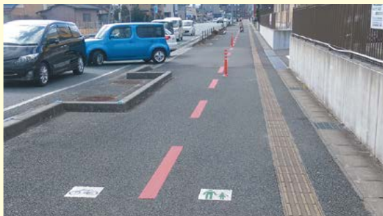
通行区分のラインを施工し、歩行者と自転車を分離