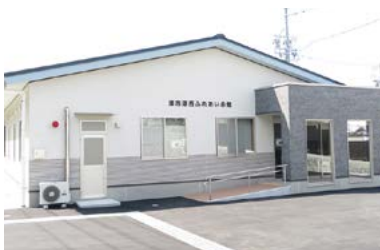
建築工事中の津西ふれあい会館

新たな地域コミュニティの場として津西ふれあい会館を建築しています。同会館は研修室など3室を備え、地域の活動等にご利用いただけます。