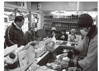
昨年のあじわいウォークの様様