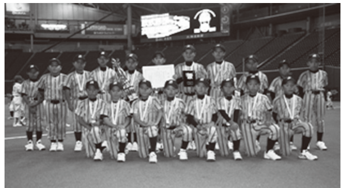
このインタビューの後、全国3位を成し遂げました。