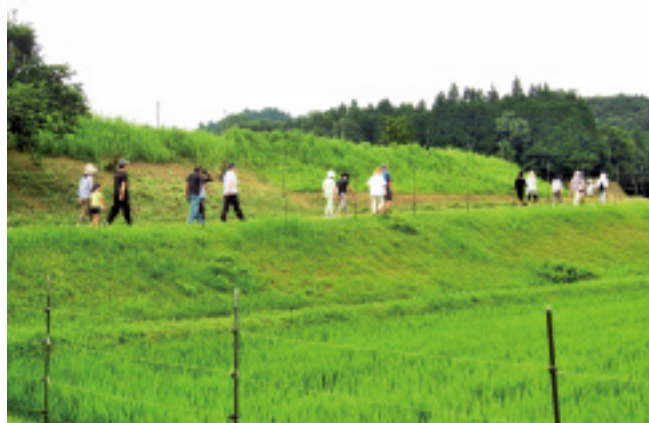
7月の「歩こう会」の様子