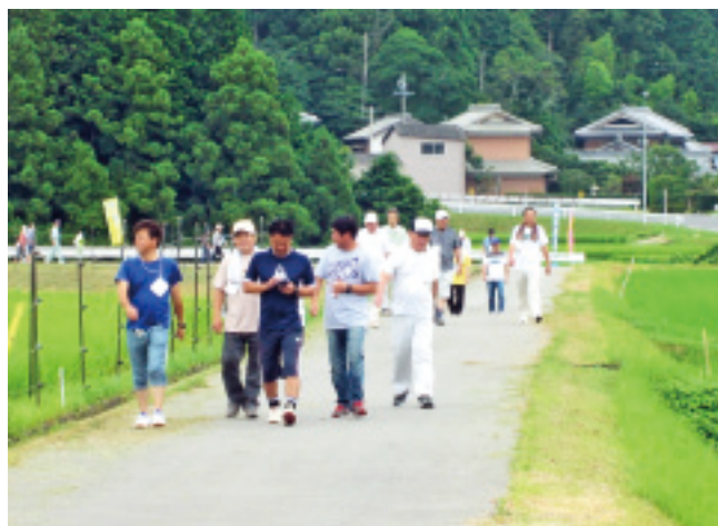
7月の「歩こう会」の様子

現在、歩いている農道の一部の水田に、今年から「田んぼアート」が実施されています。この活動をアピールして、他の自治会にも水平展開できればと思っています。