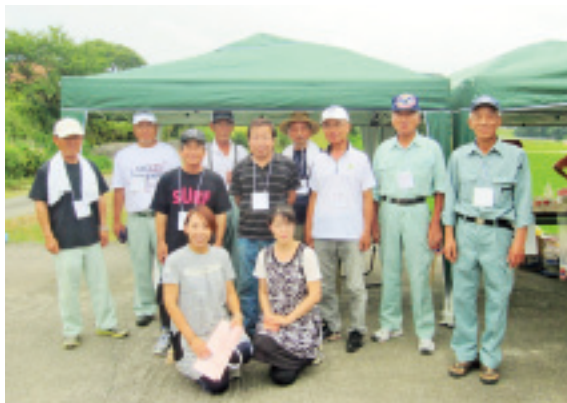
元気に「歩こう会」の皆さん