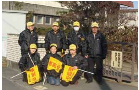
立成けいび隊の皆さん