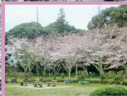
高通児童公園 (久居西鷹跡町)