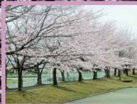
久居体育館 (久居野村町)