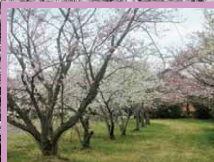
自衛隊久居駐屯地