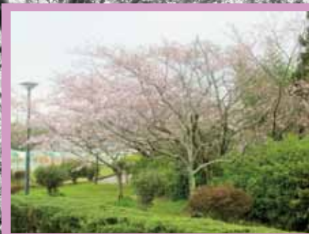
久居中央スポーツ公園 (戸木町)