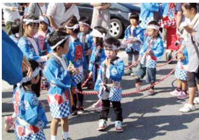
久居まつりでの「子どもみこし」

年頭に当たり、次代を担う子どもたちの健やかな成長を願い、我々の果たすべき役割について、今一度見つめ直してみましょう。