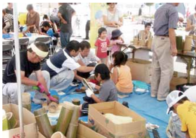
「ひさいっ子ふれあいまつり」