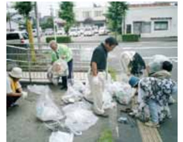
恒例の清掃活動の様様