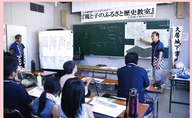
8月9日 親子のふるさと歴史教室の様子