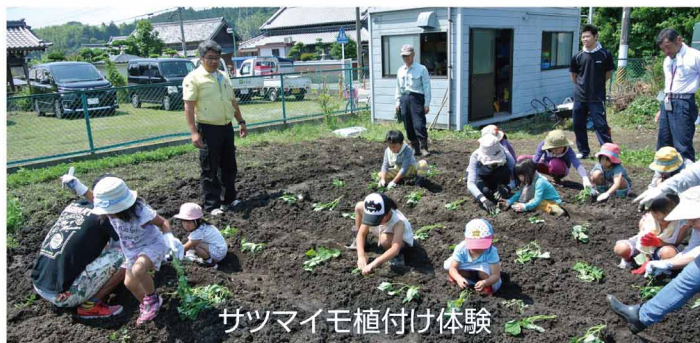
サツマイモ植付け体験