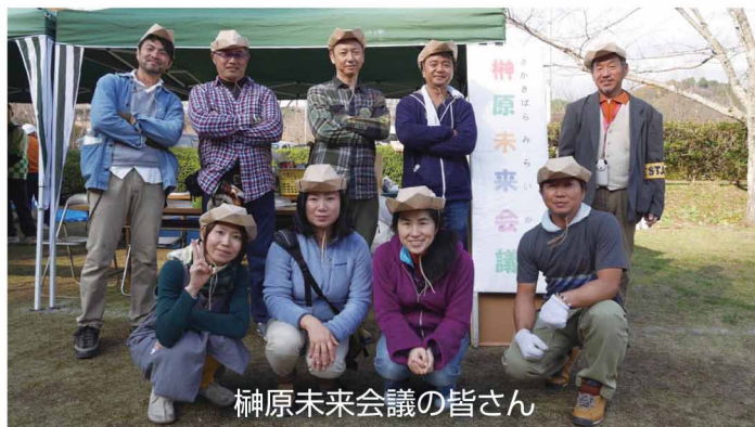
榊原未来会議の皆さん