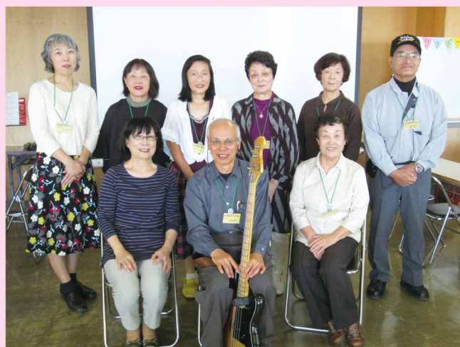
ボランティアスタッフの皆さん