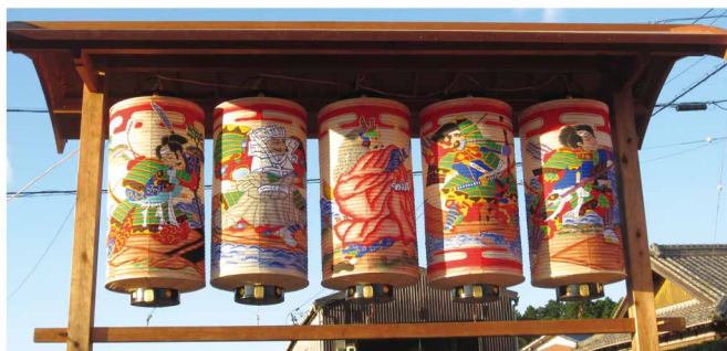
北門のちょうちん