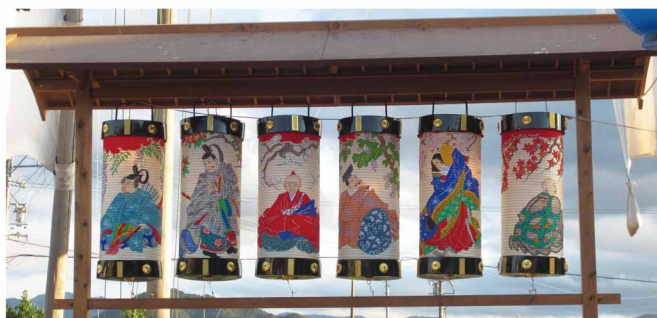
南門のちょうちん