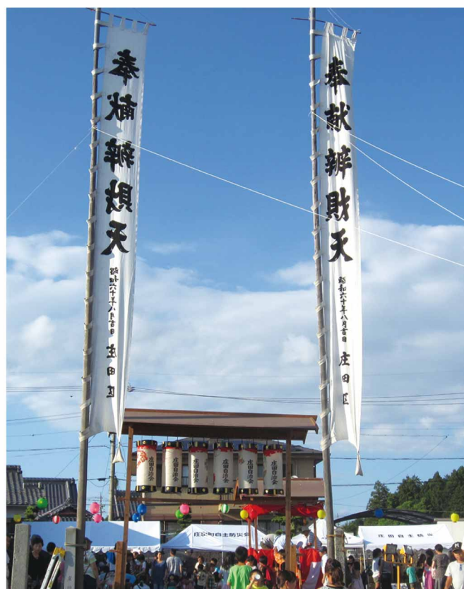
南門に立てられたのぼり