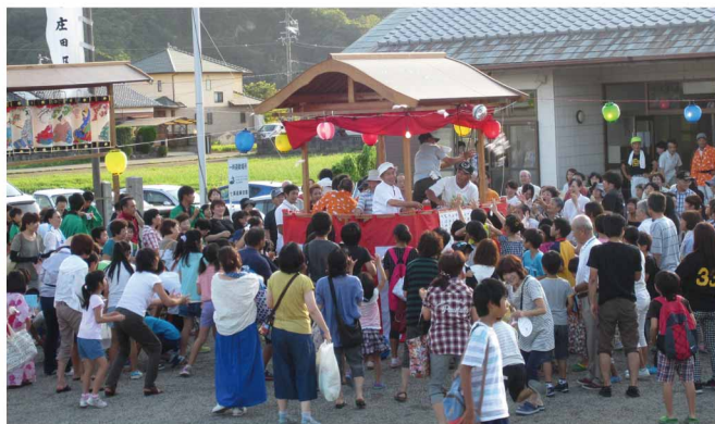
昨年8月に行われた祭りの様子

祭りの日には、会場の七栗産業会館に、のぼりが立てられ、広場の南門と北門にはちょうちんが取り付けられます。