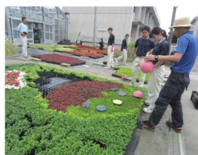
インターハイ階段装飾 製作の様子

講習会は小学生から高齢の人まで、いろいろな年齢の人と交流します。話し方や話すスピードなど、どうしたら伝えたいことが伝わるか、工夫しないといけないことが分かりました。高校生でそういう体験ができてよかったです。