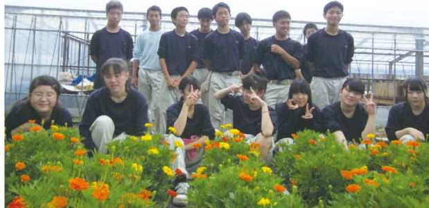
夏休みの実習で集まっていた皆さん