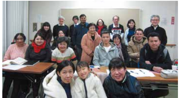
ボランティアと受講生の皆さん