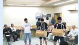
練習に励む地元の皆さん

今年は、平成6年を最後に活動を休止していた榊原地区3区で踊りが復活します。現在、10月の射山神社秋祭りでの踊りの披露に向けて、地域の皆さんが練習に励んでいます。