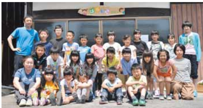
支援員の皆さんと子どもたち