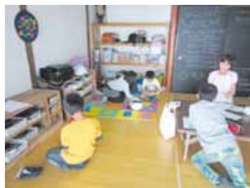
宿題したり、遊んだり