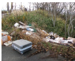
不法投棄された廃棄物