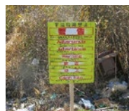
不法投棄禁止看板