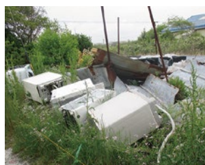
不法投棄された洗濯機

津市では不法投棄者が判明した場合、投棄者自身で処理するよう指導していますが、投棄者が不明の場合は土地の所有者(管理者)が自らの責任でごみを処理しなければなりません。土地の所有者(管理者)の皆さんは、不法投棄されにくい環境をつくるため、右記のような方法で自己防衛をしましょう。