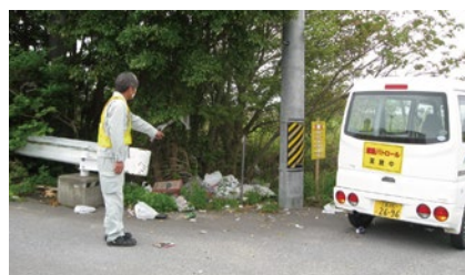
不法投棄防止環境パトロールの様子

公共マナーを無視した身勝手な行動により、土地の所有者(管理者)や市民の皆さんに迷惑をかける行為は許されません。きれいな津市を維持していくためにも、次の項目について皆さんのご協力をお願いします。