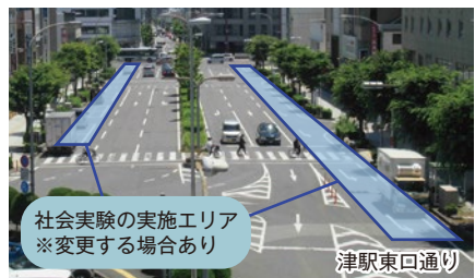
社会実験の実施エリア ※変更する場合があります