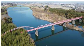
補修を行う雲出川水管橋