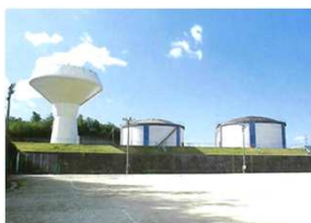
耐震補強を行う河辺配水池