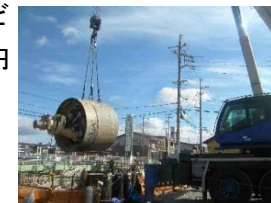
半田川田雨水幹線築造工事