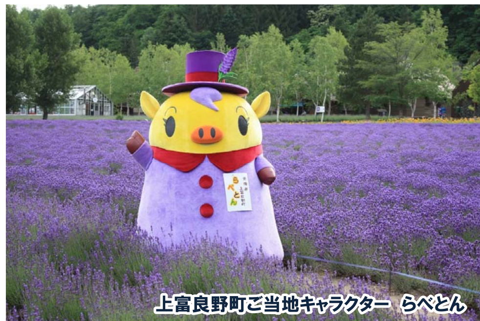
上富良野町ご当地キャラクター らべとん