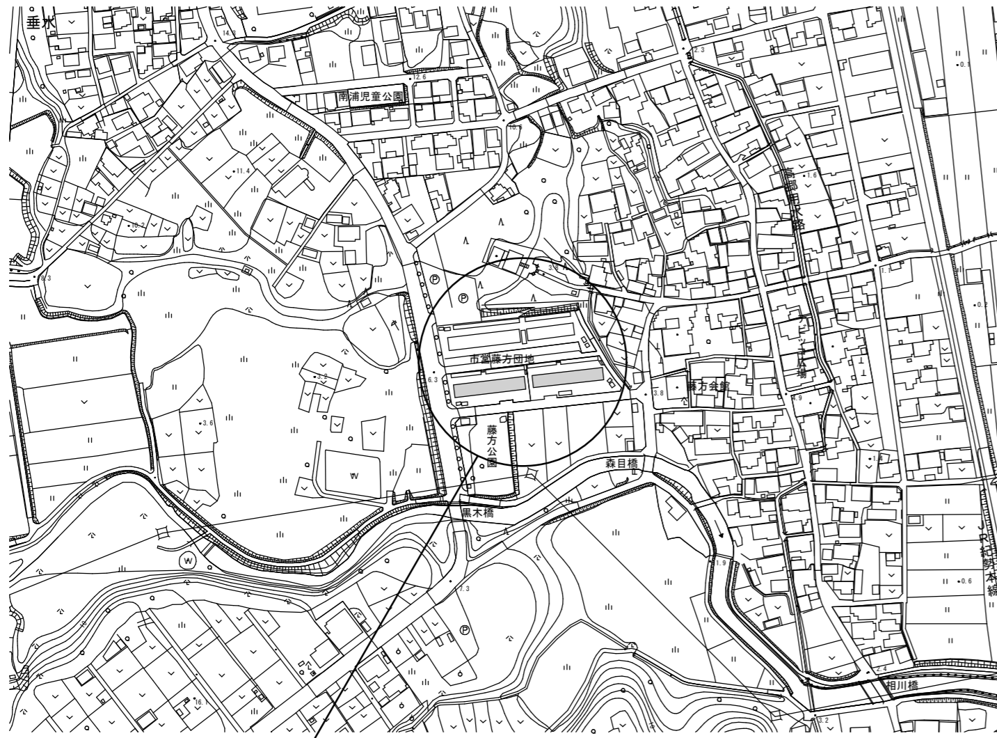
工事場所（津市藤方297）