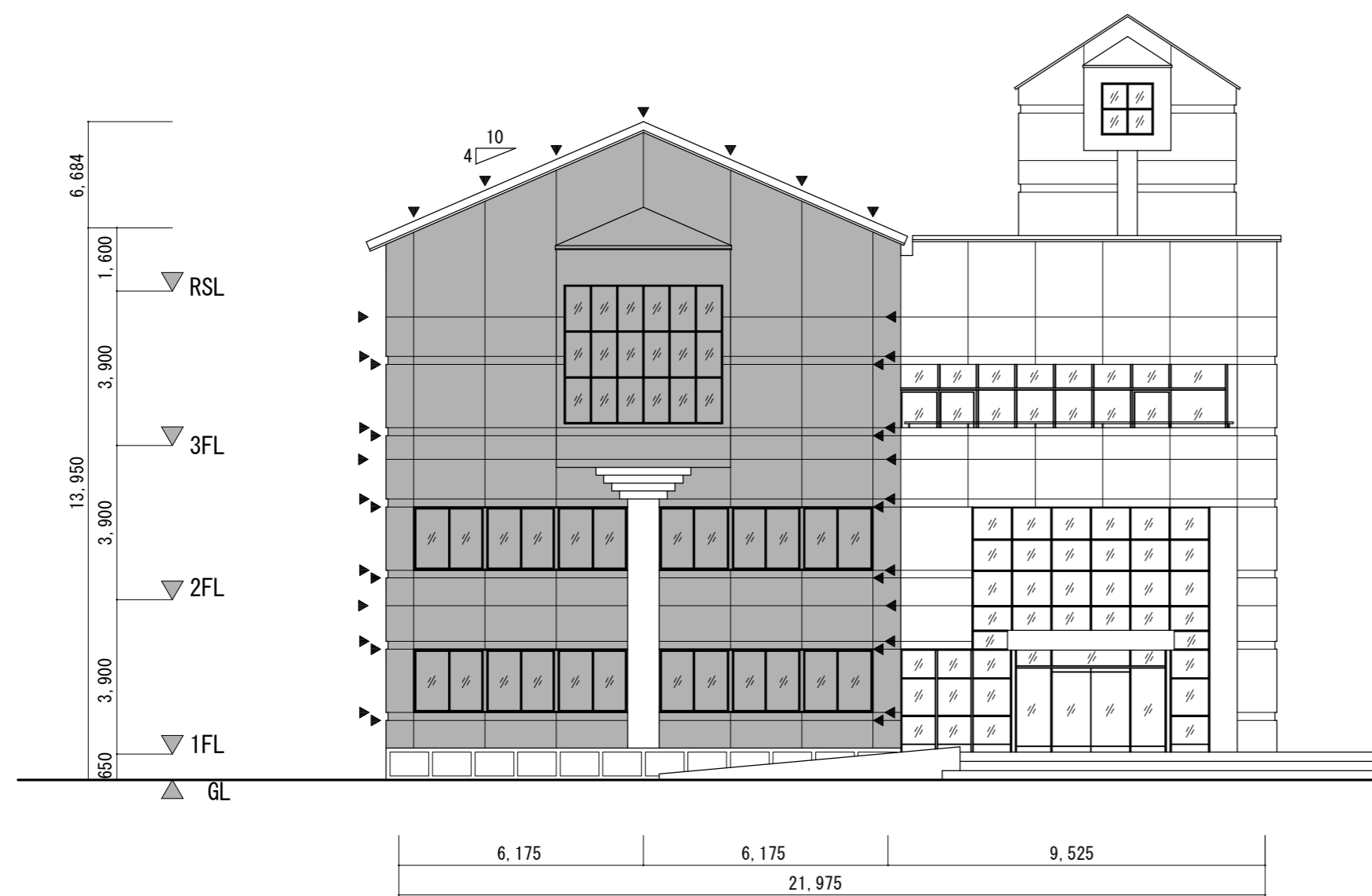
東立面図 S : 1 / 150